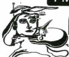
Imagen DEL PASO